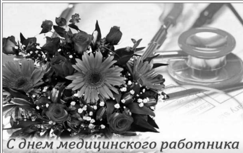
С днем медицинского работника

Газета признана Лучшей Прессой Республики Дагестан Победителем 8 Всероссийского Фестиваля СМИ "Вся Россия-2008"